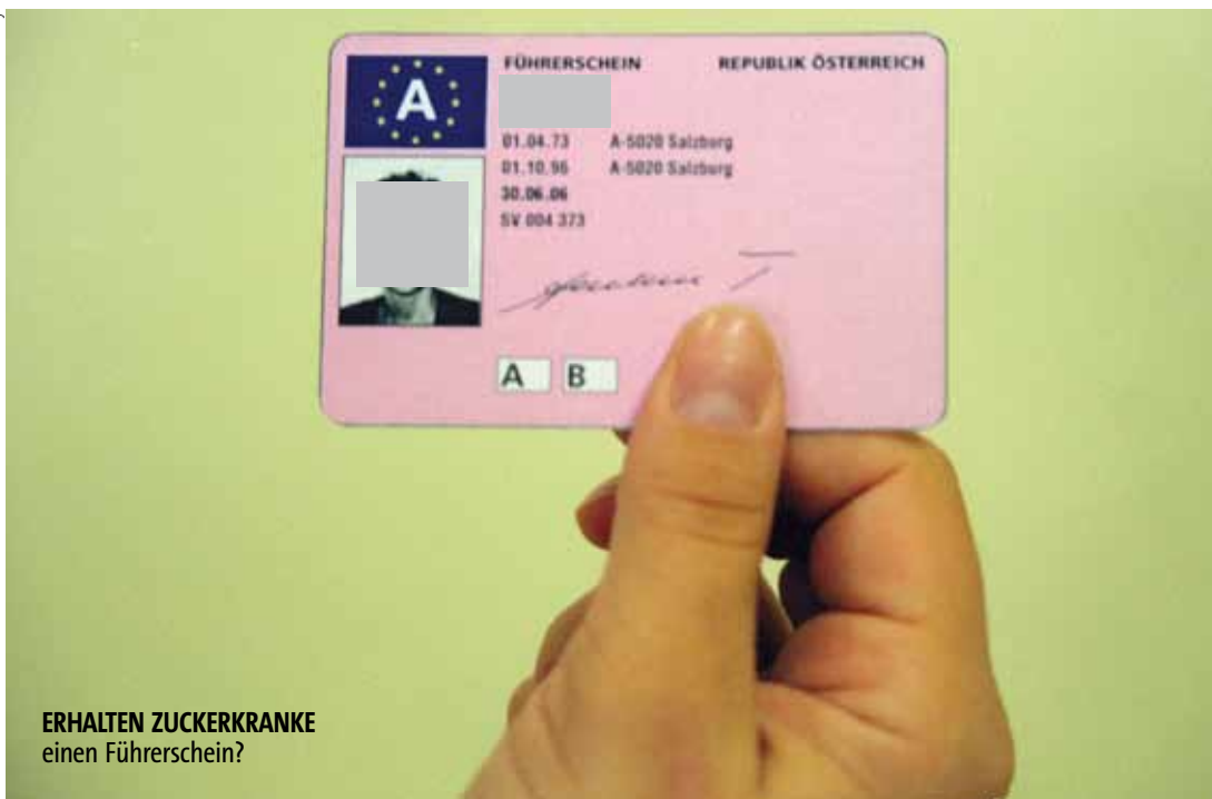
ERHALTEN ZUCKERKRANKE einen Führerschein?

Führerschein-Gesundheitsverordnung • normiert