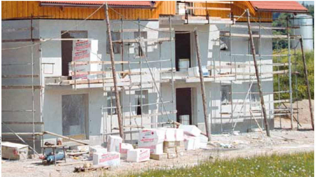
WER HAFTET, wenn der Hausbau teurer wird als geplant?

Es empfiehlt sich, Baukostenlimits jedenfalls schriftlich festzulegen und eindeutig als solche zu bezeichnen. Ein Hinweis in der Honorarvereinbarung mit dem Architekten („geschätzte Bausumme“) reicht dafür nicht aus.