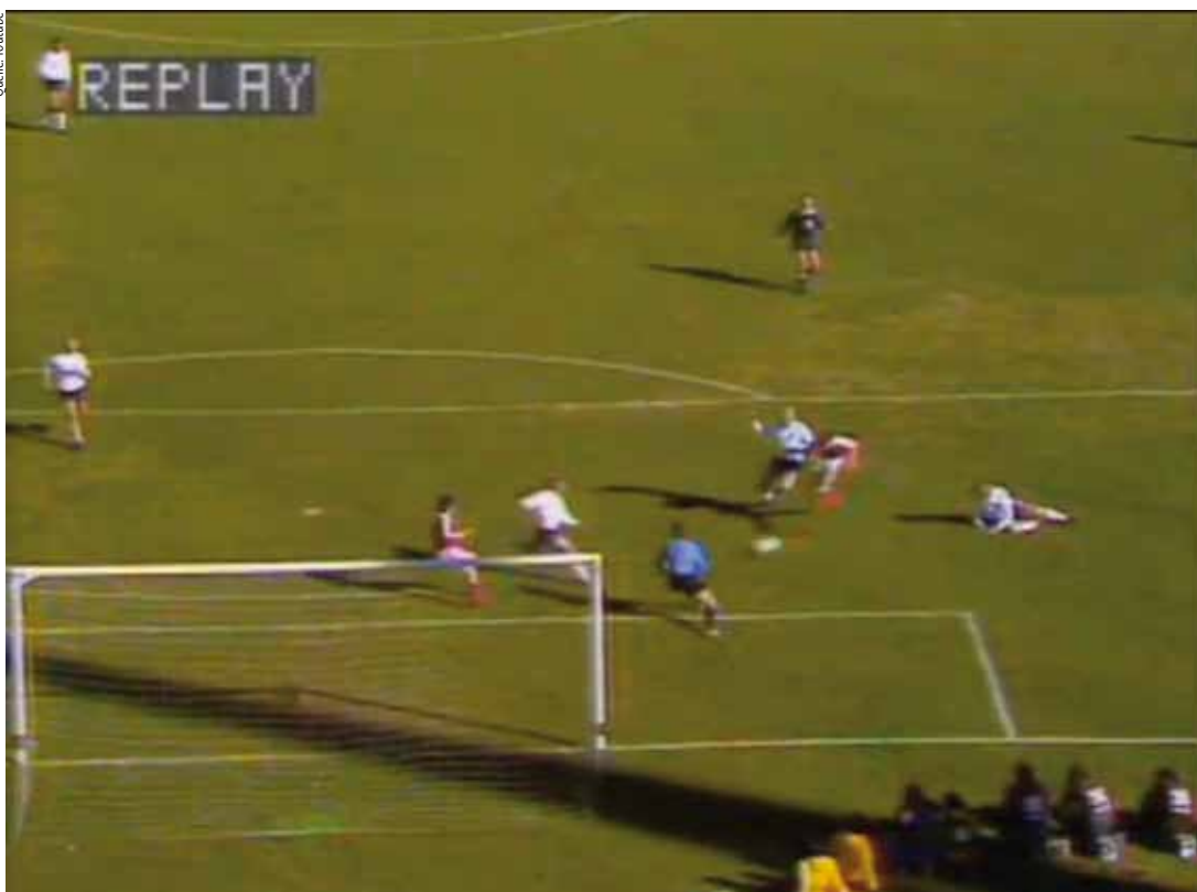
CORDOBA 1978: Hans Krankl trifft zum 3 : 2.

„Tooor, Tooor, Tooor ... ! • I wer' narrisch!“