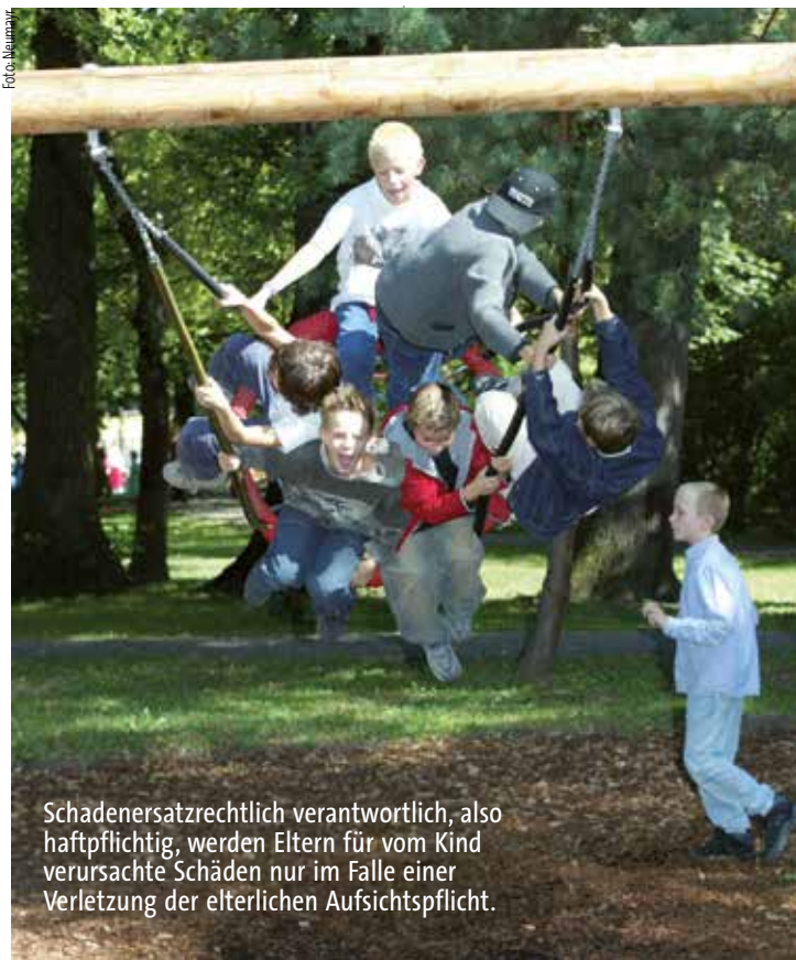
Schadenersatzrechtlich verantwortlich, also haftpflichtig, werden Eltern für vom Kind verursachte Schäden nur im Falle einer Verletzung der elterlichen Aufsichtspflicht.

Können wir schon „die Kinder nach unserem Sinne nicht formen“, wie Goethe sagte, so schafft das Gesetz durchaus einen sachgerechten Ausgleich zwischen den Interessen der Eltern an notwendigen Freiräumen für ihre Kinder und den berechtigten Anliegen Dritter, Ersatz für durch Kinder erlittene Schäden zu erhalten.